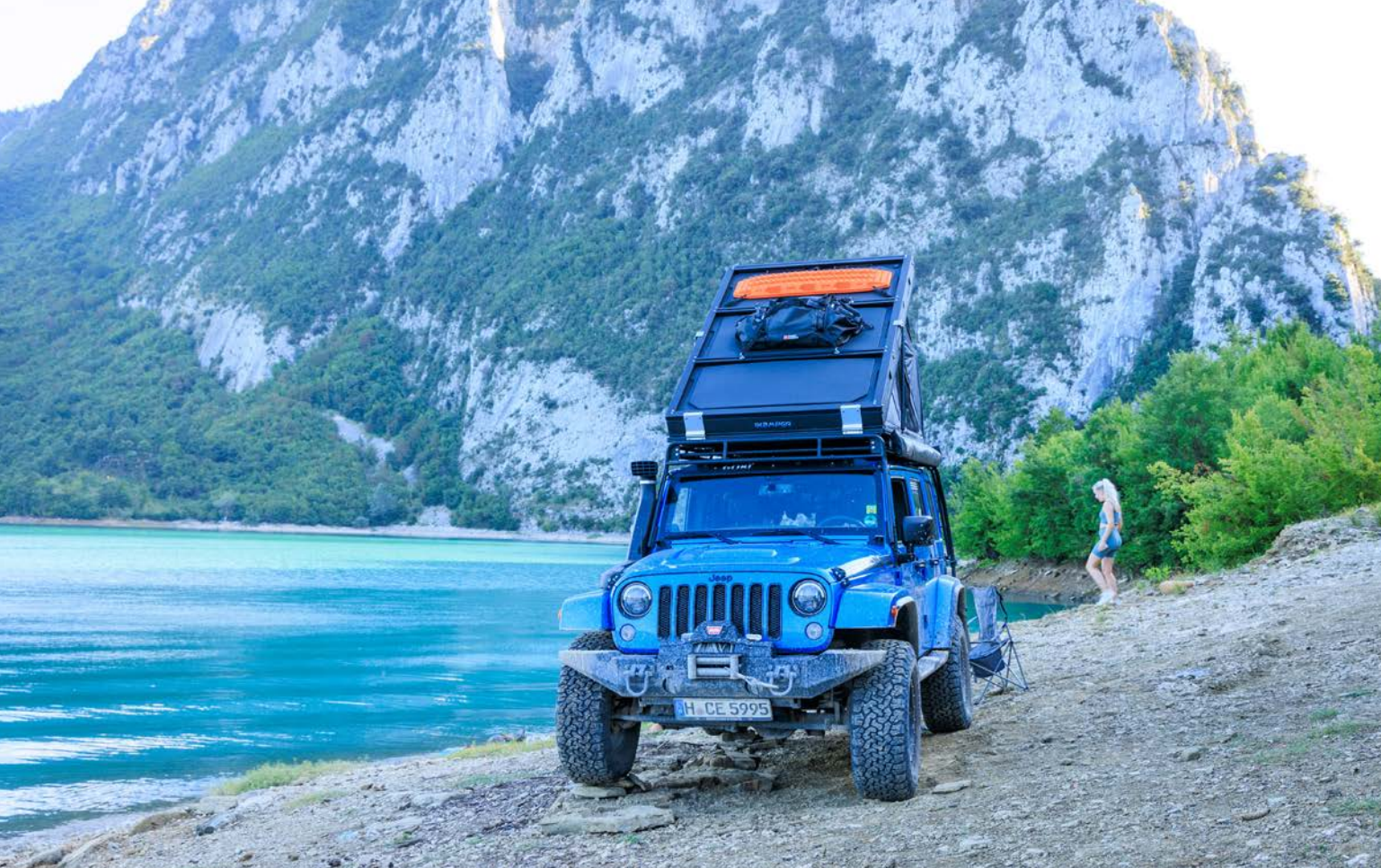
JE KUNT PRACHTIG WANDELEN EN WILD KAMPEREN BIJ LAKE BOVILLA, TWINTIG KILOMETER BUITEN TIRANA.